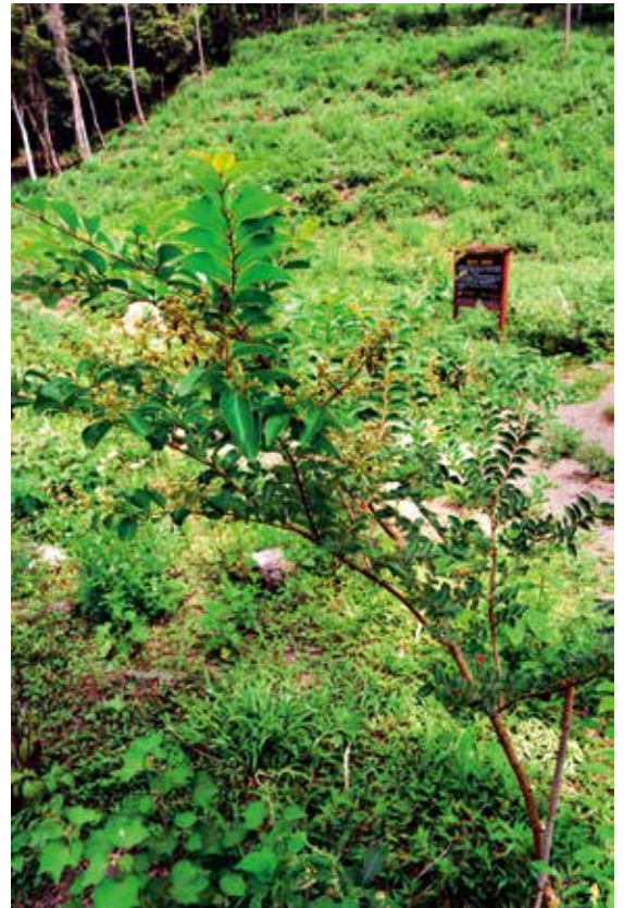
在林務人員細心照顧下 小樹苗長高茁壯 甚至已開了花