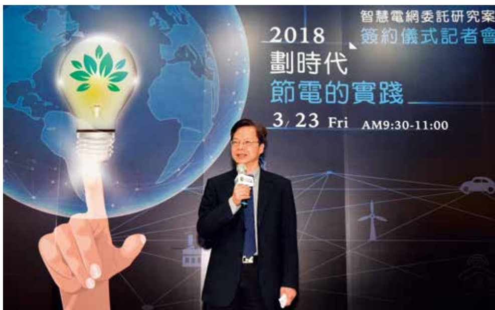
經濟部次長龔明鑫稱許日月光集團一向是企業節能減碳的「優等生」