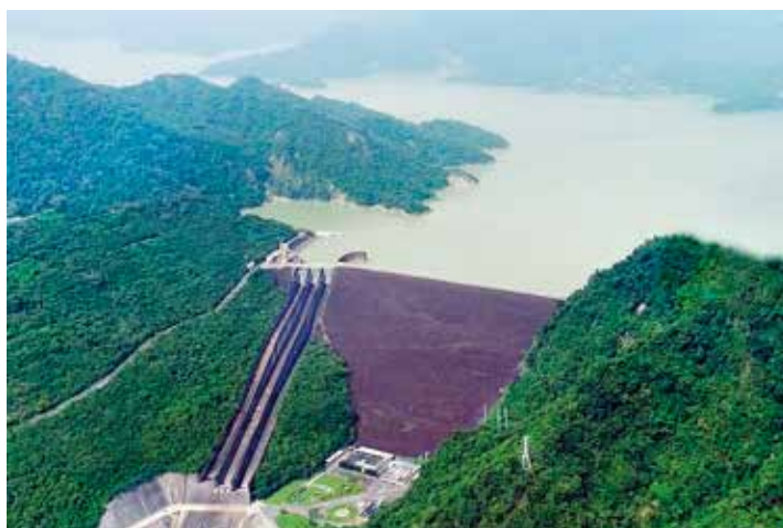
曾文水庫是台灣容量最大的水庫，屬於滾壓式土壩，壩頂標高 235 公尺。

曾文溪是台灣第四大河流，全長 138 公里、流域面積 1177 平方公里，主要流經嘉南一帶，最後流入台灣海峽。