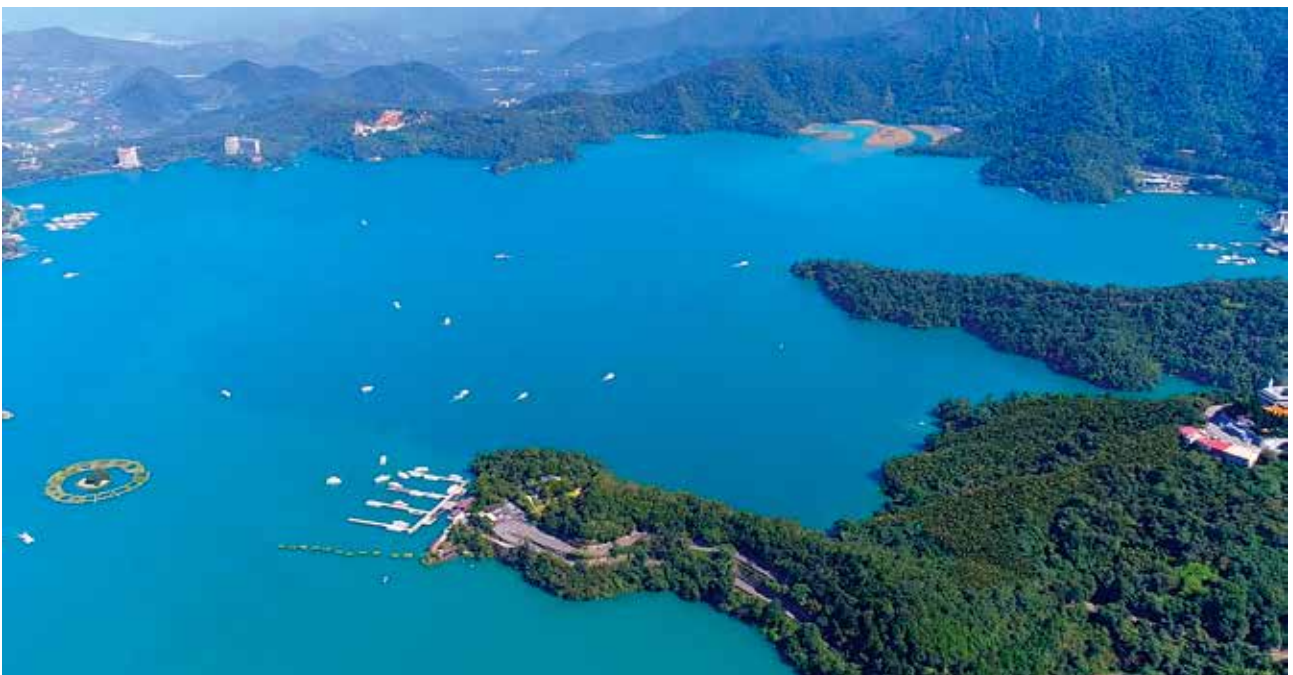
日月潭水力發電計畫，是農業台灣成為工業台灣的關鍵時刻，屬於台灣水力發電代表作。

沿著濁水溪先後興建，明潭發電廠北山機組（北山坑發電所）、濁水機組（濁水發電所）與新武界引水隧道、武界壩、日月潭壩堤工程，從 1916 年規劃，經過 19 年後完工，堪稱台灣極為重要的水力發電歷史。