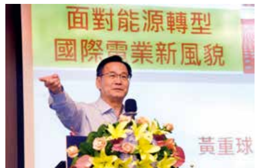
黃重球講座／面對能源轉型國際電業新風貌

台電前董事長黃重球說明 電業自由化和能源轉型目的、再生能源及傳統發電設施 探討未來發展趨勢和可能影響 政府電業面對新趨勢的因應準備 講題內容豐富 座無虛席