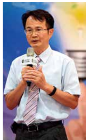
經濟部標準檢驗局副局長陳玲慧（左圖）表示，很高興日月光對再生能源的支持。經濟部能源局組長吳志偉（中圖）表示，台灣能源轉型，需要企業與政府的通力合作。環保署環境衛生及毒物管理處簡任技正邱國書（右圖）表示，樂見研究單位與企業的合作，為我們的環境盡一分力。