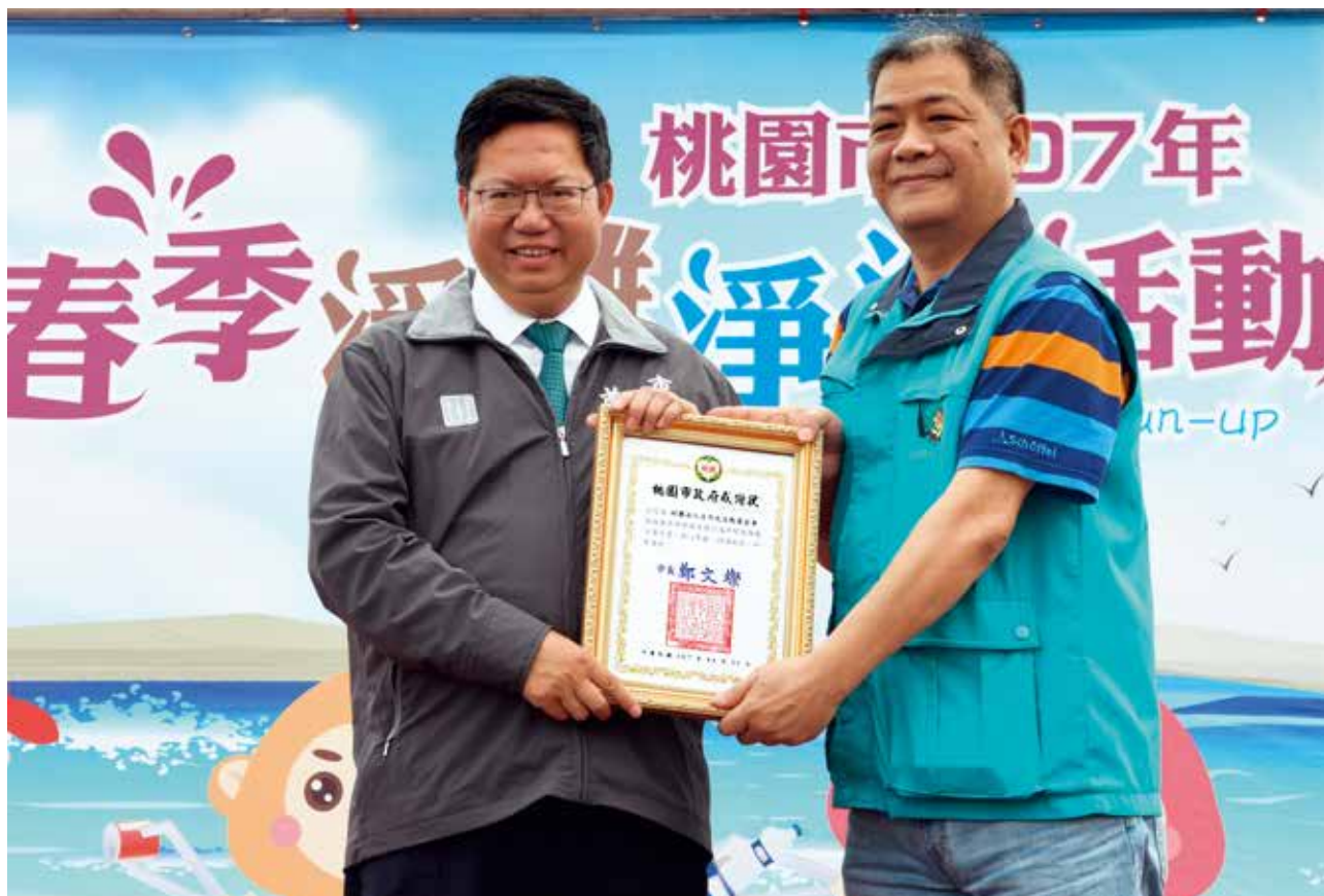
桃園市長鄭文燦（左）頒發感謝狀給日月光文教基金會，表彰日月光文教基金會捐贈桃園市環保艦隊，對於執行海洋環境維護宣導計畫的努力與熱心奉獻的行動，可以作為企業參與推動環保工作的良好示範，由日月光文教基金會總監林浚南（右）代表接受。