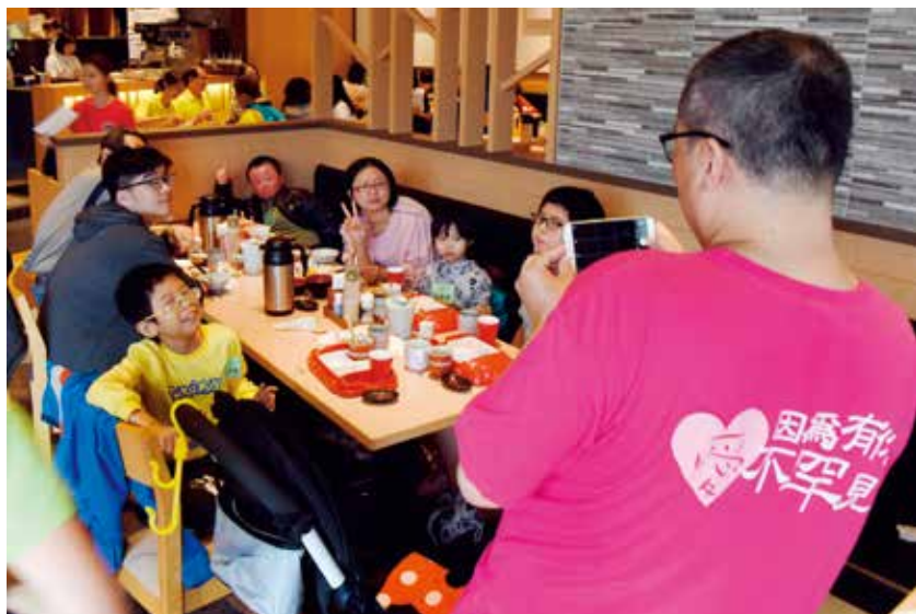
因為有你 愛不罕見 病友愉快用餐 交換抗病經驗