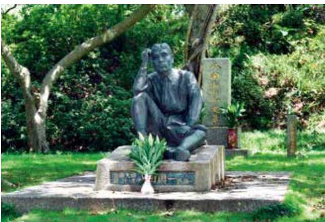
嘉南大圳設計者八田與一銅像

台灣最悠久且仍在運轉的電力設備 高屏發電廠竹門機組 1909年完工的德國製造發電機組 2003年被列為國定古蹟 仍具教育意義與觀光目的