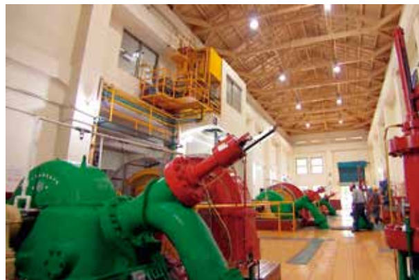
清水機組是花蓮第一座水力發電廠，採用橫軸佩爾頓式水輪機。