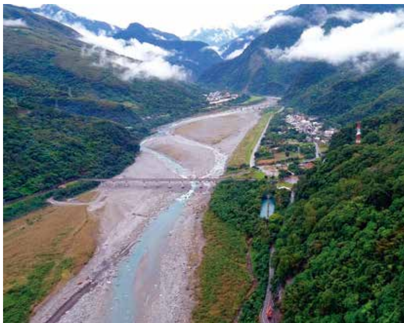
木瓜溪流域水力發電量為台灣第三，僅次於大甲溪與濁水溪。

因應東部發電廠組織及人員精簡，裁撤原本的控制室，11 座電廠皆在 2001 年 5 月改名為機組，全部由花蓮市區的廠本部遠端遙控各機組。