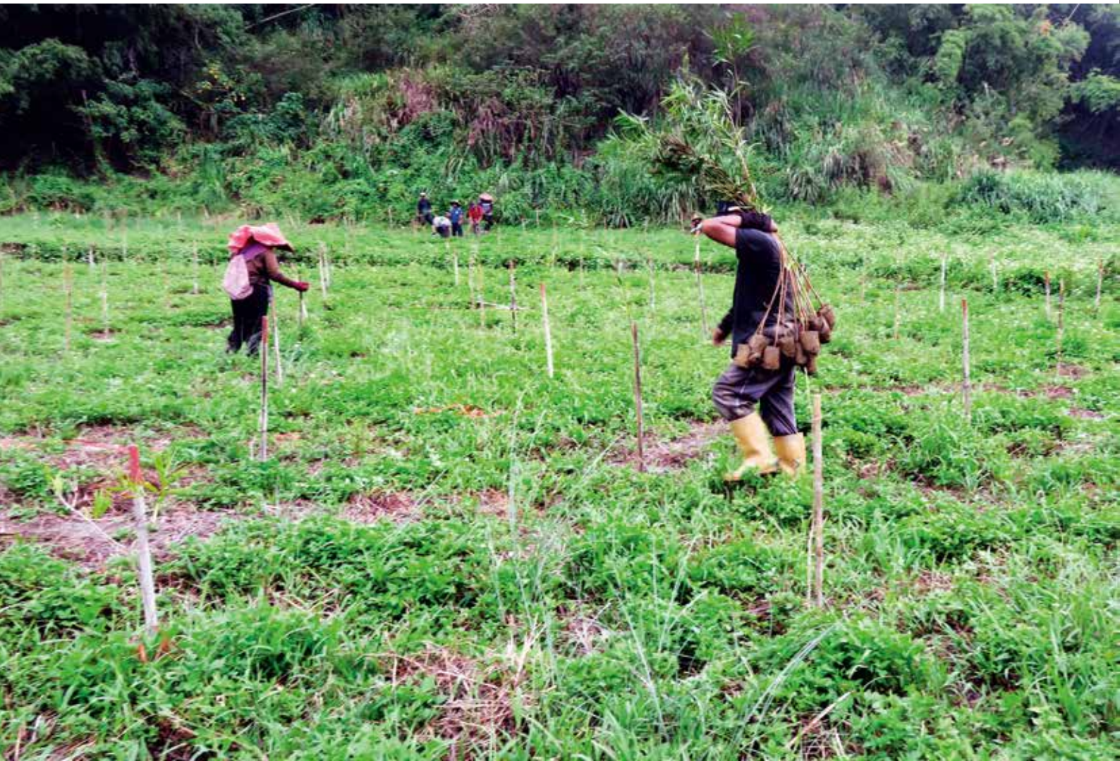
20180823 南部水災 高雄市田寮區 106 林班樹苗受創 林務人員災後補植相思樹