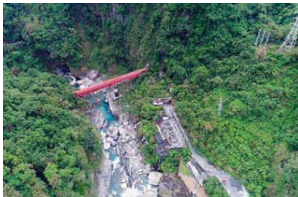
龍澗機組發電的水頭落差高達 855 公尺，是亞洲最高落差的水力發電廠。