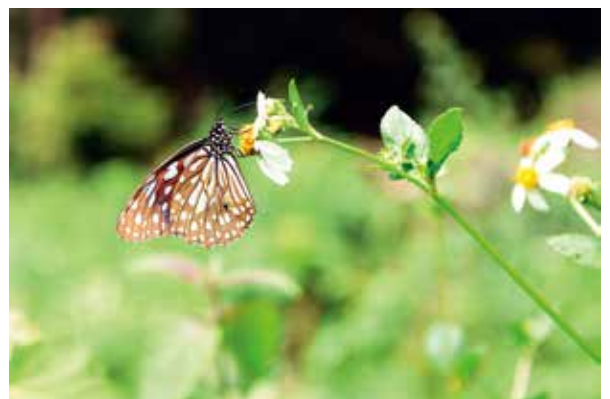
高雄市桃源區小關山附近的造林地 種下的台灣欒 已經 2 米多高 亦見蜂蝶成群