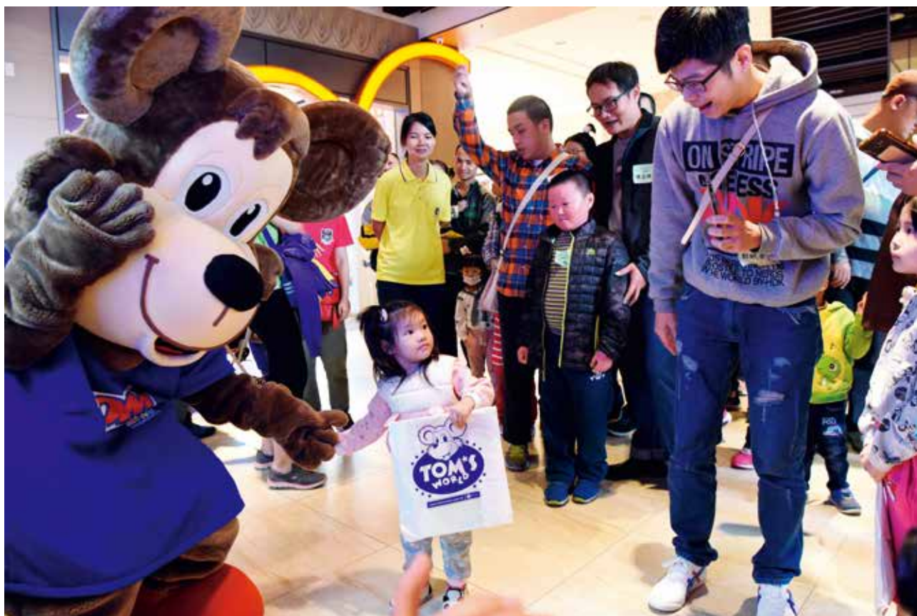
「卡哇依」湯姆熊玩偶是大、小朋友的開心果