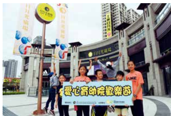
芥菜種會愛心育幼院 8 名院童參訪日月光廣場

全台 NO.1 獨家引進的「VR 雷霆戰艦」 愛心育幼院童首次乘坐 直呼「比搭雲霄飛車、摩天輪還刺激」 一天忘情遊樂 笑容掛在嘴角