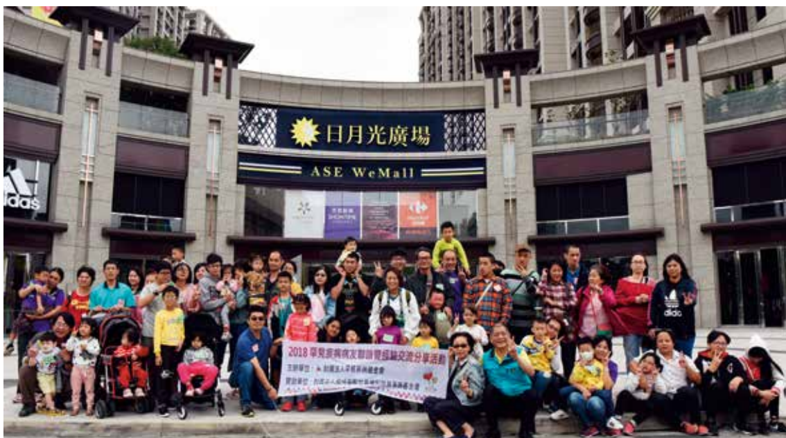
罕病病友聯誼暨經驗交流分享活動 74 名病友及家屬參加 呼籲民眾共同關心罕病病友 他們在日月光廣場度過愉快一天