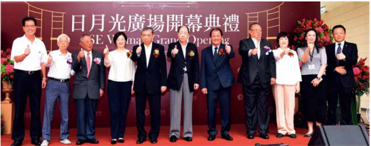
醒獅鼓舞團的表演，為土城日月光廣場開幕帶來好兆頭，與會貴賓一同豎起大拇指說「讚」