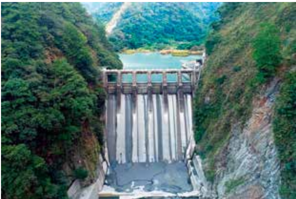
武界水庫大壩 1934 年完工，共六個閘門，一副閘門 113 公噸，近 30 萬人力完成。

沿著濁水溪先後興建，明潭發電廠北山機組（北山坑發電所）、濁水機組（濁水發電所）與新武界引水隧道、武界壩、日月潭壩堤工程，從 1916 年規劃，經過 19 年後完工，堪稱台灣極為重要的水力發電歷史。